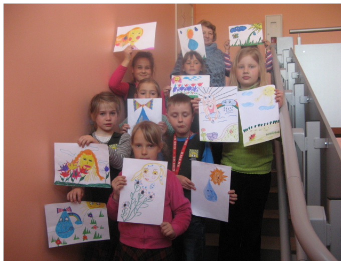
Savo piešinius demonstruoja mokyklos jaunieji žurnalistai