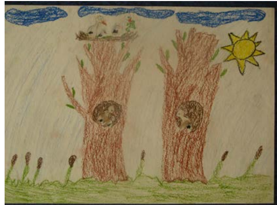
2b klasės mokinių piešiniai